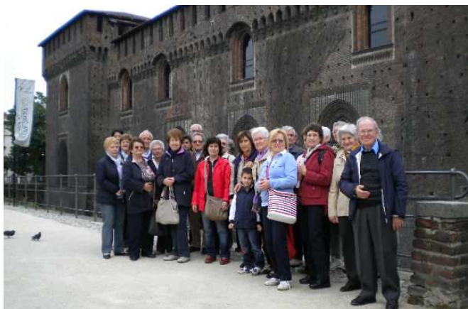
Foto di gruppo dei partecipanti alla gita a Milano

In data 15 maggio 2010 è stata organizzata una gita a Milano con visita del Castello Sforzesco e del Duomo.