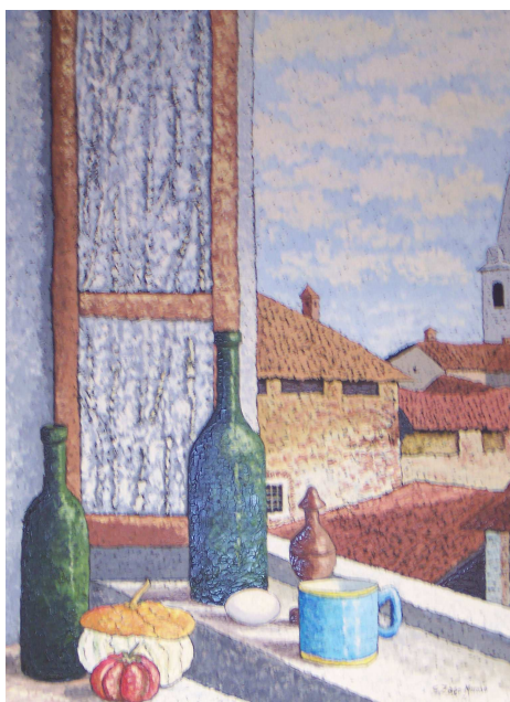
G. Zago Moroso - Il centro storico visto dalla finestra della casa dell'artista.

Come avete notato sono stati ultimamente individuati nuovi parcheggi a tempo. L'intervento è teso ad ottimizzare l'uso dello spazio disponibile, identificando come aree di posteggio libero i due piazzali di via Roma ed utilizzando invece come posteggio a tempo gli spazi davanti agli esercizi pubblici. La decisione è stata motivata dall'aumento del traffico, dall'esiguità degli spazi disponibili e da ragioni di sicurezza.