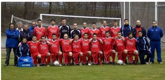
La squadra del Briga Calcio