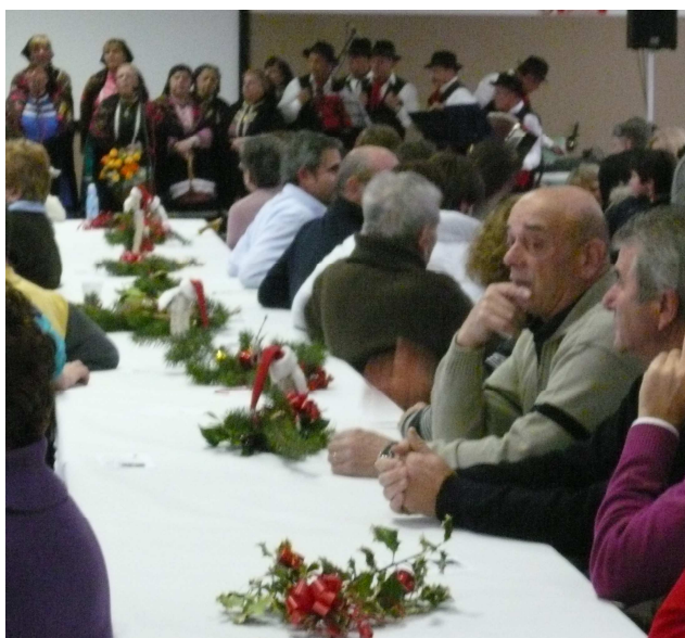
Festa degli auguri