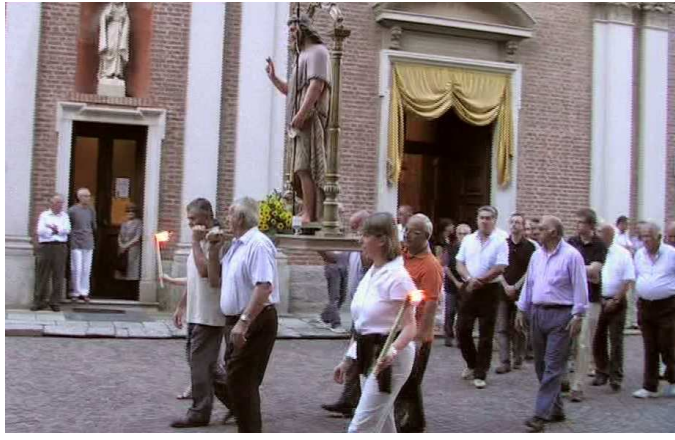
2008 – Processione con la statua di San Giovanni