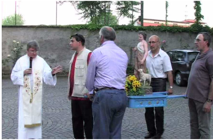
2008 – Processione con la statua di San Giovannino

Per San Giovanni c'era l'usanza di far benedire un mazzo di fiori. Andavano a cercarli nei prati, nei campi e nei boschi. Erano quasi tutte "arancus sylvester" (sajëti), qualche giglio, qualche ramo di ligustro e margherite. C'era qualcuno che per abbellirlo inseriva qualche ramo di ribes, di amarene o di ciliegie. Il giorno della festa, prima della messa solenne, issavano il mazzo in cima ad un bastone perché si vedesse meglio e poi lo portavano in chiesa per farlo benedire; quindi lo portavano a casa e lo appendevano sul balcone o in solaio per farlo essiccare. D'estate, quando c'era qualche temporale che spaventava, per scongiurare le tempeste, lo bruciavano in mezzo al cortile insieme al ramoscello d'ulivo.