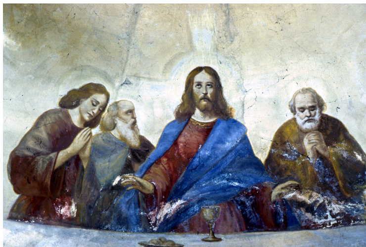
Particolare di un affresco nella Chiesa Parrocchiale

PROVERBIO Pane e panni non danno mai danno.