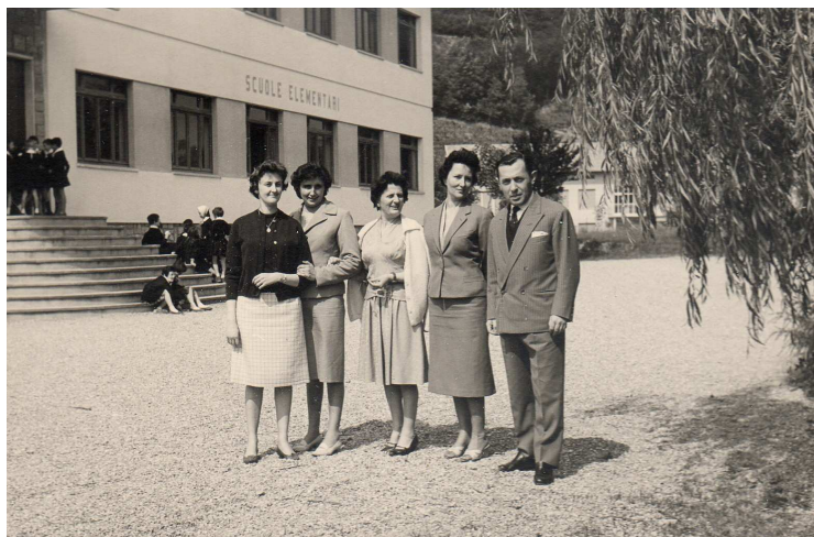
196... - I maèstri e 'l maèstär di scoli

Una domenica siamo ndati a la Madona di Loropa a chiamare la grazia per mia sorela che è mariata da cinque anni e non ciä mica bambini. Siamo ndati, poi abiamo pregato, poi abiamo disnato, poi siamo vegnuti casa. O che abiamo pregato male, o che non ci siamo capiti con la Madona, fatostä che è rimasta incinta l'altra sorela che non è gnanca mariata.