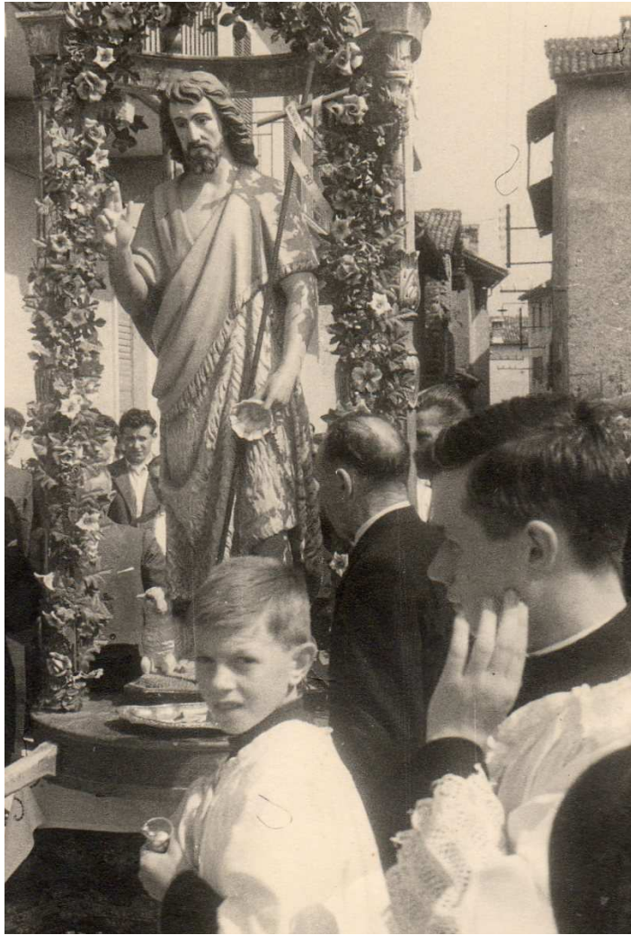
195... - Pusiön äd Sän Giuan