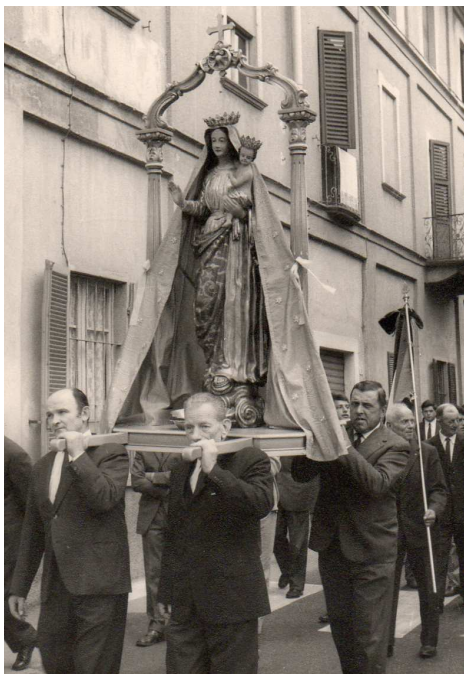
1969 – Pusion d'la Madonä 'd sitembär