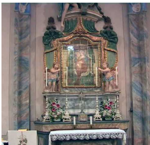
Chiesa Natività (altare)