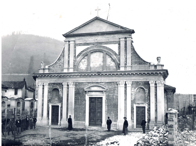
193.. - La gesä 'd Sän Guan Batistä

G. Zago Moroso. (faciä via ver i busck äi mees d'utobär dal minanouentsisäntänoou.)